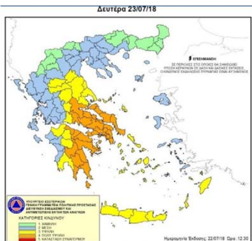
Image 1 : Carte de risques de départ de feux du 23 juillet 2018 lorsque l'incendie catastrophique d'Attique de l'Est a causé 100 morts.